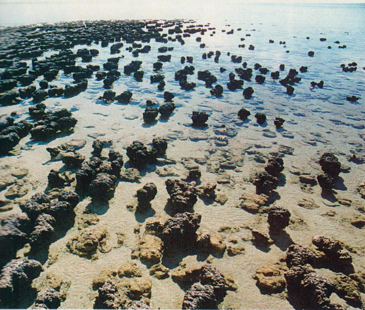
OTO IHERITIMAGE SOURCEFAP

Manuelinas, organizadas por D. Manuel I, em 1514, dedicaram vários capítulos à preservação dos recursos naturais e indiretamente da biodiversidade. Portugal foi o primeiro país da Europa a sistematizar um corpus legal dessa magnitude. O livro V, no título “C”, tipificava o corte de árvores frutíferas como crime. Em Portugal, isso representava uma dúzia de espécies (macieiras, nogueiras, pessegueiros, cerejeiras, pereiras...). Estendida às terras descobertas, essa legislação ganhou um alcance enorme. Nas terras brasílicas, araçás, jabuticabas, taperebás, cambucás, pitangas, grumixamas, muricis, jatobás, pinhões, abiús, mangabas, araticuns, cajás, uvaias, cambucis, oitis, guabirobas, jenipapos, bacuris, goiabas, cambuís, pitombas e tantas outras frutas nativas tiveram suas árvores-mães legalmente protegidas do corte e da derrubada.