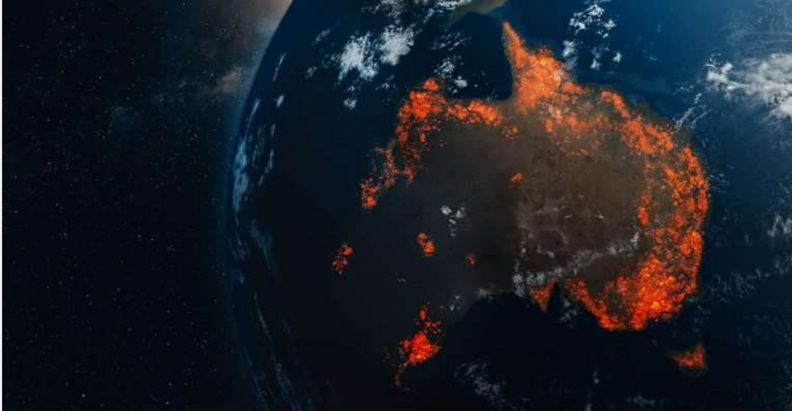
Focos de incêndio na Austrália