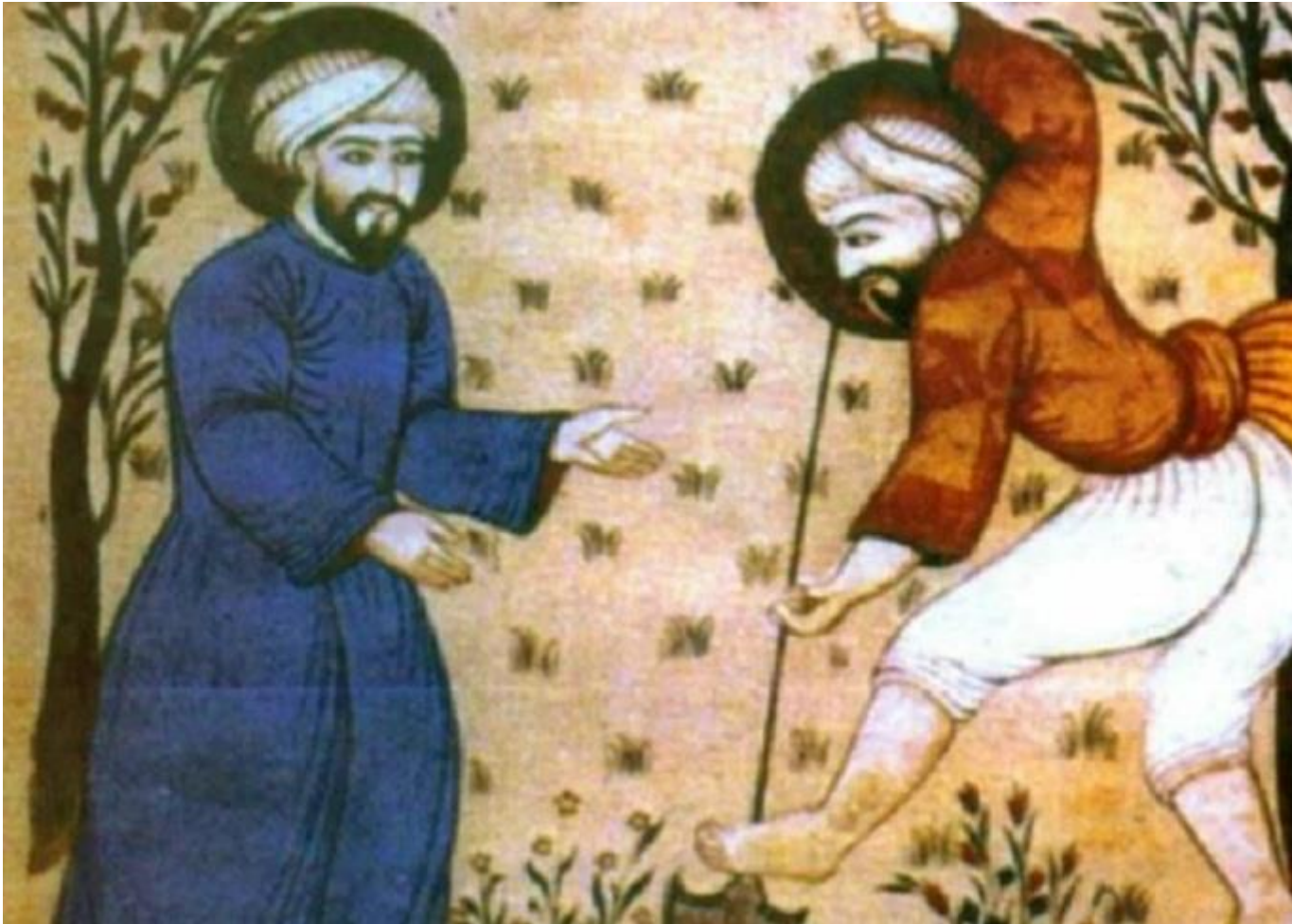
Ibn Al Awan: o pai da agronomia e da veterinária.

Sua obra detalha o cultivo de 151 espécies de árvores abordando técnicas de propagação, meios de multiplicação, plantação, condução, poda, enxertia e tratamentos fitossanitários. E distingue a reprodução sexuada nas árvores. O capítulo XIII se intitula Fecundação Artificial das Árvores .