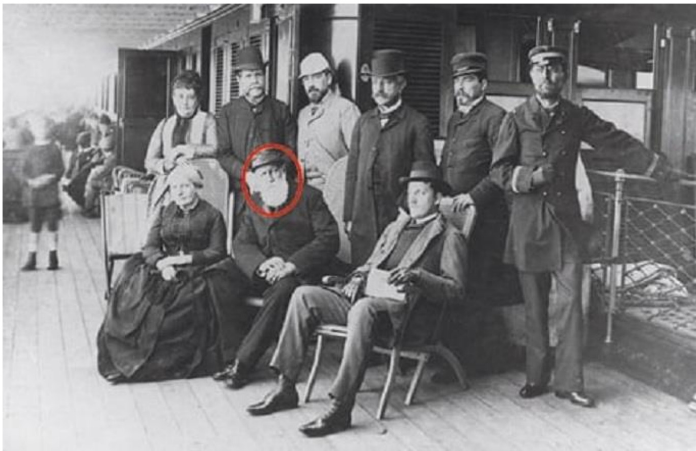
Dom Pedro II, em viagem ao Líbano.

E concedeu terras a esses imigrantes, de forma organizada, sobretudo no Sul e Sudeste, num modelo de colonização e assentamento cujo sucesso ainda tem muito a ensinar. No Líbano, o imperador afirmava: os árabes seriam recebidos de braços abertos no Brasil e prosperariam. Seu impulso à imigração deu certo. Poderia Dom Pedro II imaginar uma comunidade de origem libanesa no Brasil, como hoje, numericamente superior à população do Líbano? Quatro anos mais tarde, em 1880, aportavam os primeiros imigrantes árabes. A eles juntaram-se imigrantes de diversas nacionalidades da Europa e do Oriente, e foram a base da nova agricultura e agroindústria. Até a expansão recente do agronegócio no Centro-Oeste e Matopiba resulta de seus descendentes.