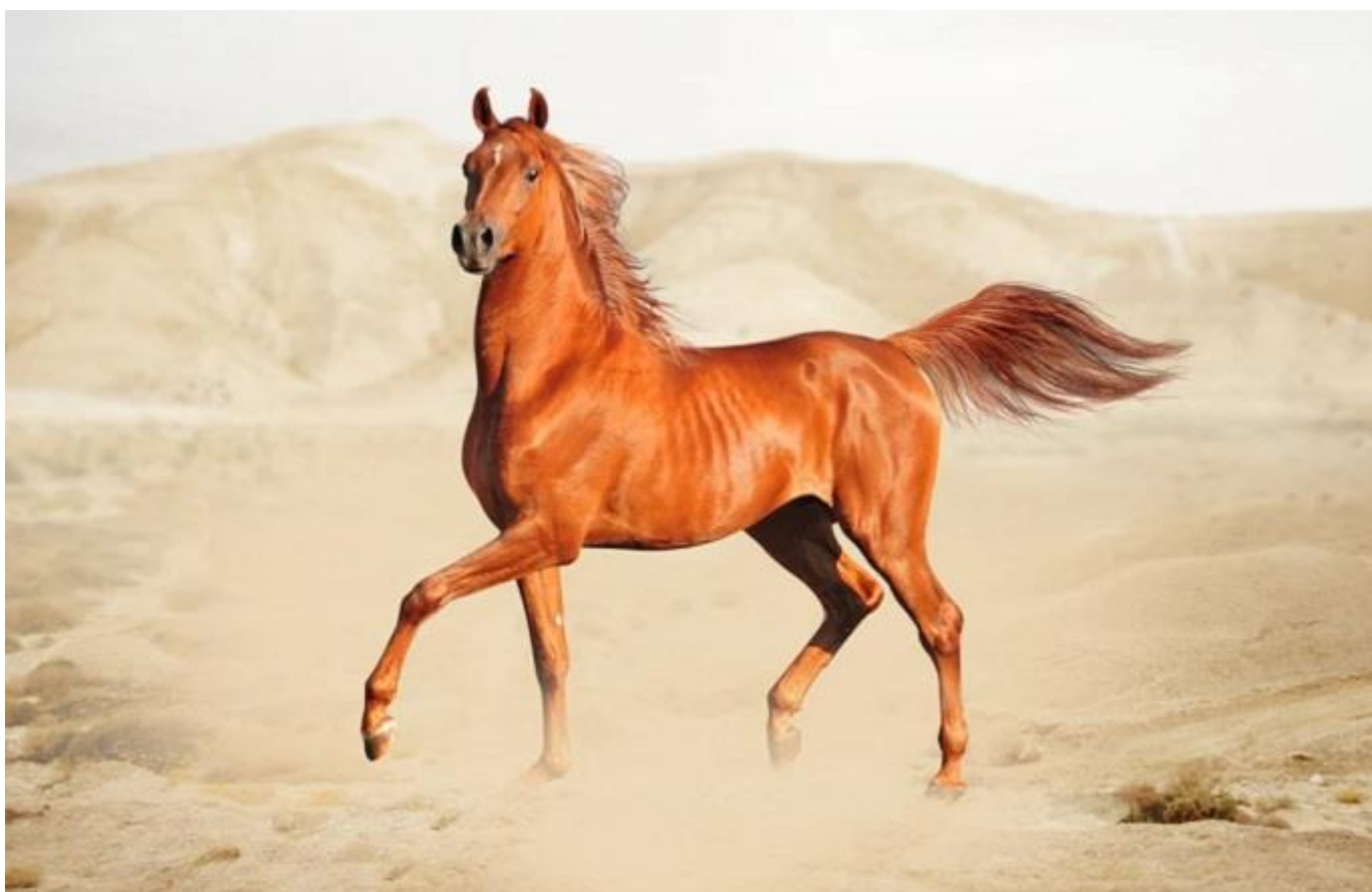
Cavalo árabe de raça pura.

Frango, açúcar, carne bovina e grãos lideram as exportações do agro. Os dois maiores destaques em crescimento foram Emirados Árabes Unidos e Arábia Saudita. A Liga Árabe é o quinto fornecedor em importações: US$ 9,82 bilhões, em 2021, um crescimento de 82% com relação a 2020 (combustíveis, fertilizantes e alumínio).