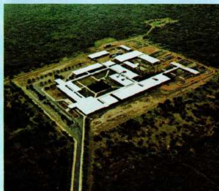
O CPATSA estuda alternativas para resolver os problemas do semi-árido