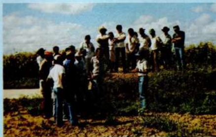
Nos Campos Experimentais os visitantes conhecem as tecnologias do CPATSA