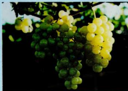
Agricultura irrigada — uma das áreas de pesquisa do CPATSA