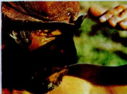
Uma das metodologias criadas pelo CPATSA

MÉTODOS DE PESQUISA EM SISTEMAS SÓCIO-ECONÔMICOS