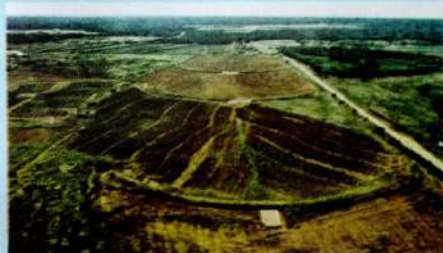
Barragem subterrânea — uma das tecnologias aperfeiçoadas pelo CPATSA