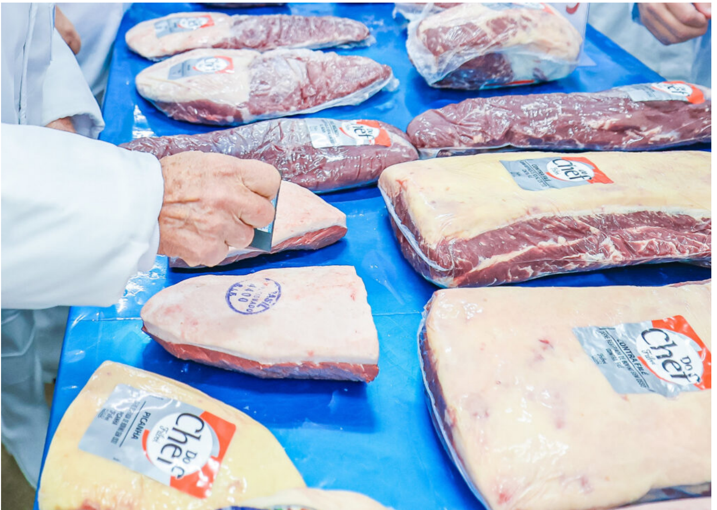
O presidente Luiz Inácio Lula da Silva durante visita a planta frigorífica em Campo Grande (MS), em 12/04/2025

O conflito no Oriente Médio já afeta a agropecuária brasileira. Há dificuldades crescentes na exportação dos produtos do agro e na importação de insumos agropecuários, como consequência da alta do preço do petróleo e da insegurança. Oriente Médio e países do Golfo são um destino estruturante da produção agropecuária brasileira. Alguns setores do agro foram logo afetados, como as refrigeradas cadeias de proteína animal.