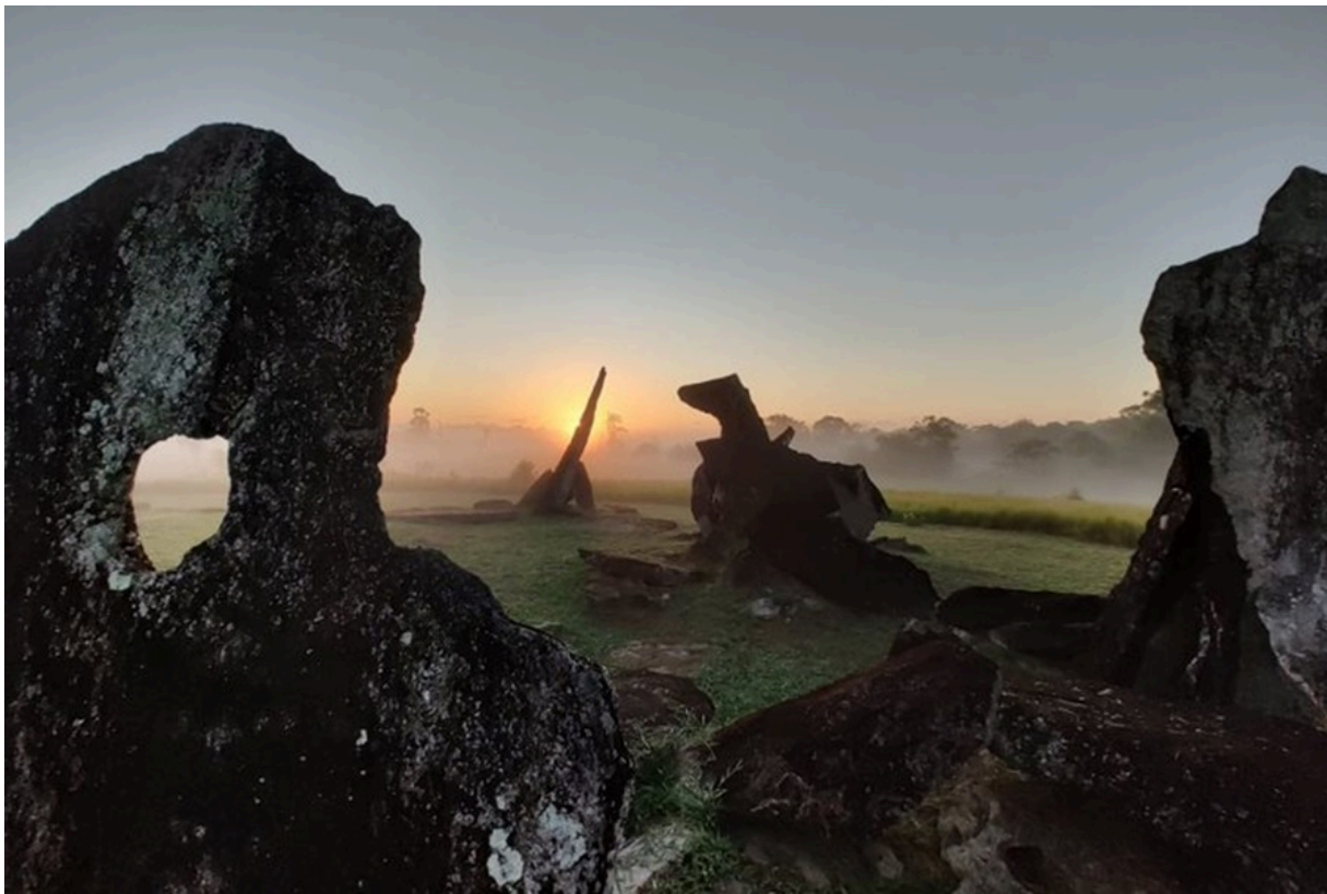
Parque do Solstício, no município de Calçoene (AP).

No próximo 21 de junho será o solstício de inverno. Há milênios, os povos observam os eventos cósmicos planetários dos dois equinócios e dos dois solstícios. Eles dividem o ano em quatro períodos de três meses. Desde o Paleolítico, várias culturas construíram megalitos para marcar essas datas cósmicas e organizar calendários, como no Parque Arqueológico do Solstício em Calçoene, Amapá.