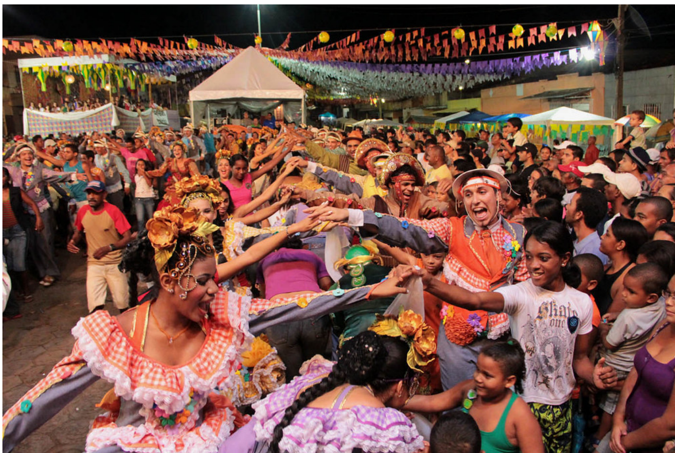
Quadrilha Junina Lumiar, no Sao João, em Alianca, Zona da Mata Norte de Pernambuco.

Junho marca a passagem do outono ao inverno. Começa a estiagem, típica do inverno em regiões tropicais. O solstício de inverno está associado ao fim das colheitas, ao desfrute do árduo trabalho no campo. É tempo de aferir, conferir, pesar, contar, vender e armazenar. Apesar de grandes diferenças territoriais, num país imenso como o Brasil, até junho encerram-se as colheitas de soja, milho, arroz, feijão, laranja, amendoim, algodão e outras. Para a agropecuária, as colheitas se apresentam abundantes. A cada ano, com tecnologia, mais recordes de produção, apesar dos vaticínios de catástrofes climáticas e narrativas terroristas verdes. Os agricultores festejam mais uma supersafra para alimentar o Brasil e o mundo.